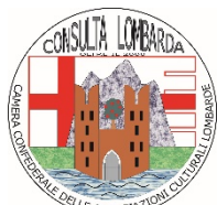
Consulta Lombarda Camera Confederale Assoc. Culturali Lombarde